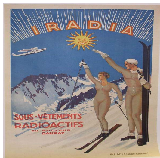
Utilisation des matériaux radioactifs