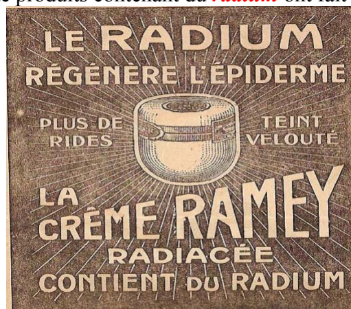
Utilisation du radium dans les produits cosmétiques

D'autre part, les effets mutagènes des radiations, en particulier les risques de cancer, ne furent découverts qu'en 1927 par Hermann Joseph Muller . Avant que les effets biologiques des radiations ne soient connus, des médecins et des sociétés attribuaient aux matières radioactives des propriétés thérapeutiques . Le radium ^{88}\text{Ra} , en particulier, était populaire comme tonifiant . Durant les années 1930, les nombreuses morts imputées à l'utilisation de produits contenant du radium ont fait passer cette mode :